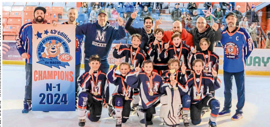
Les Mariniers de Sorel-Tracy ont réussi un doublé en remportant la finale de la catégorie M9-D1 (sur la photo) et celle du M9-D2.

formule compétitive, avec des demi-finales et finales pour les meilleures équipes.