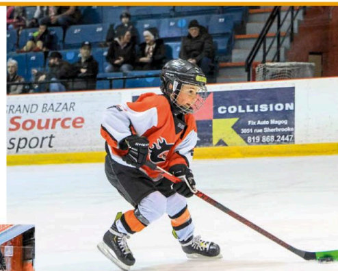
La relève du hockey est en vedette à l'aréna de Magog depuis une dizaine de jours.

La classe M7 (pré-novice) se déroule dans un format festival alors que la classe M9 (novice) se tient dans une