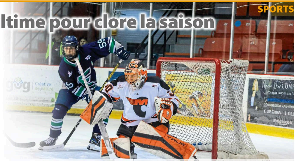
Au moment de mettre sous presse, les Estacades et les Cantonniers s'apprêtaient à livrer un match ultime à Magog, avec à l'enjeu la Coupe Jimmy-Ferrari et une participation à la Coupe Telus 2024.

La deuxième rencontre de la série, disputée