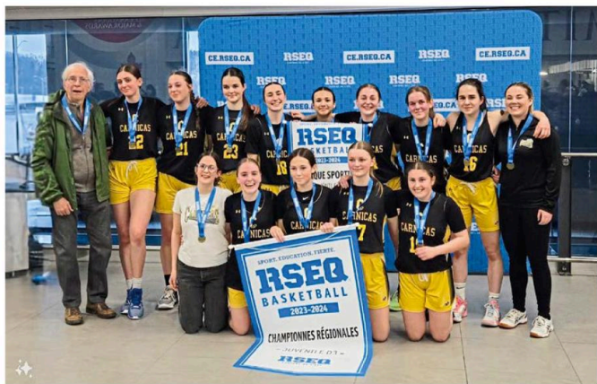
La formation juvénile ira représenter la région lors des Championnats provinciaux à Carleton-sur-Mer.

passé bien près de réaliser un tour du chapeau lors des finales régionales des Cantons-de-l'Est alors que le cadet masculin D3 ta terminé sa saison avec la médaille d'argent, à la suite d'une défaite de 58-48 en finale contre le Séminaire de Sherbrooke.