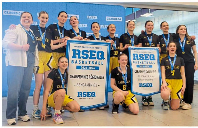
L'équipe benjamine féminine de La Ruche a récolté la double couronne régionale (saison et séries) dans la Ligue du RSEQ Cantons-de-l'Est.