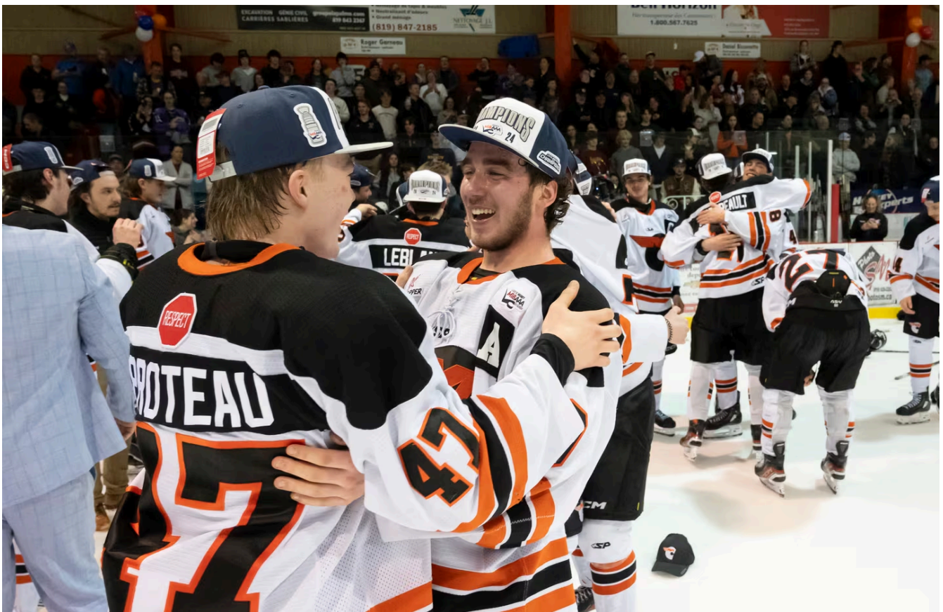
Les Cantonniers ont présenté du jeu inspiré, face aux Estacades.

Cette victoire des Cantonniers lors de la grande finale du hockey M18 AAA est un premier titre en carrière pour l'entraîneur-chef Samuel Collard.