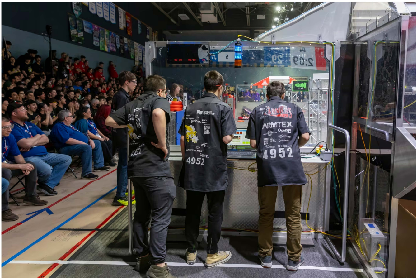
Le Festival de robotique régional s'est déroulé à Montréal au début du mois de mars. (Pierre Paradis)

Toutes les facettes des technologies de l'information sont explorées, affirme M. Marcotte. Cette année, le défi implique que le robot soit notamment en mesure de prendre et de lancer des objets, de se déplacer et même de grimper.