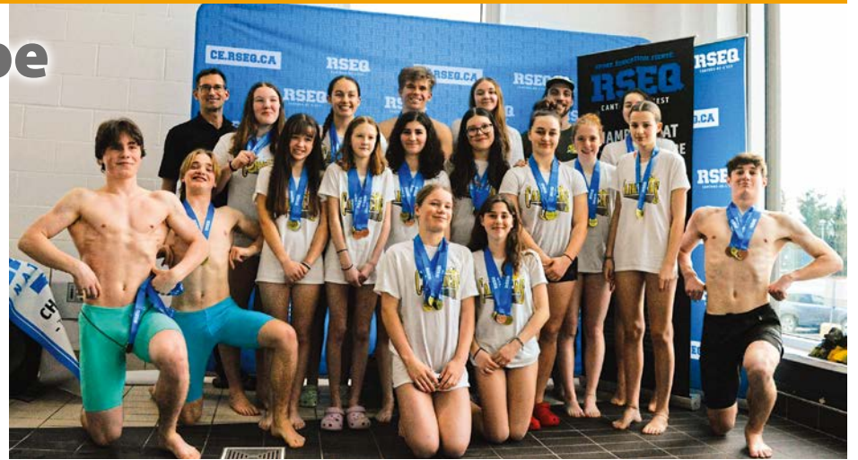
L'équipe de natation de La Ruche a accumulé les honneurs individuels et collectifs lors des Championnats régionaux du RSEQ.

« Les excellents résultats obtenus le 16 mars dernier l'ont été grâce à l'assiduité et aux efforts déployés par les membres des Carnicas natation tout au long de la saison. Ils et elles ont fait aussi preuve d'un bel esprit d'équipe dans une