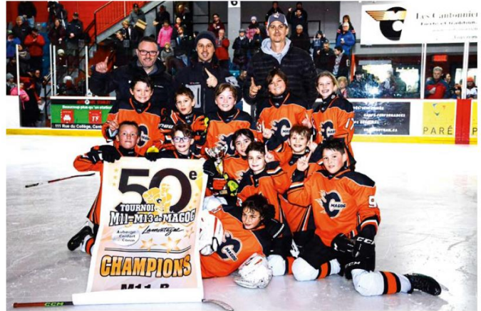
Les Cantonniers-2 ont connu une semaine parfaite au Tournoi Chocolat Lamontagne avec le titre de la catégorie M11 B.

Le 50 e Tournoi M11-M13 se poursuit jusqu'à dimanche (28 janvier) à l'aréna de Magog, avec les classes M11 A, M11 C, M13 A et M13 B à l'enjeu.