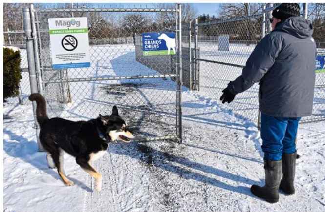
L'entretien du parc canin est jugé déficient par 135 usagers. (Photo Le Reflet du Lac - Dany Jacques)

MAGOG. 135 usagers du parc canin de Magog (chemin du Barrage) ont déposé une pétition au conseil municipal de Magog, le 15 janvier dernier. Ils réclament un entretien adéquat et plus sécuritaire de la part des employés municipaux.