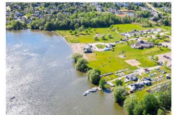
Les quatre terrains seront situés à peu près entre le Pub Le Chalet et le Club de voile Memphrémagog.

Ce chantier est passé près de coûter 20 000 $ de moins, mais le plus bas soumissionnaire (EW Excavations) a été jugé non conforme en raison d'un document absent. C'est finalement le Groupe Lapalme qui a hérité du contrat.